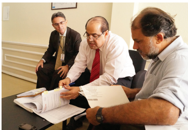
Momento de negociação do PCCs com a Diretoria da PGJ.

Dentre as alterações feitas durante a revisão do Plano, está a proposta de conversão